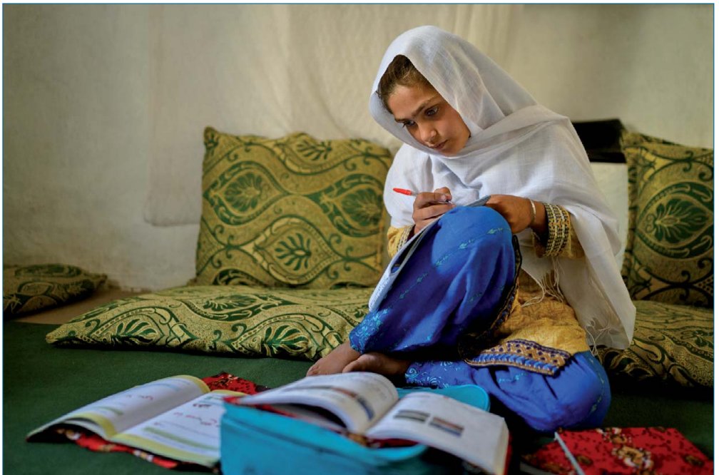
Erster Preis UNICEF Foto des Jahres 2025